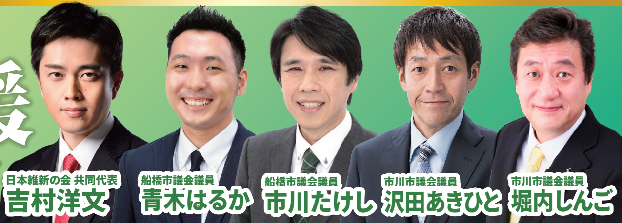
日本維新の会 共同代表 吉村洋文